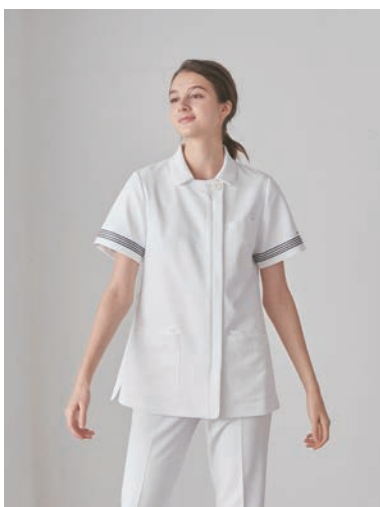
フォーラインスリーブトップス