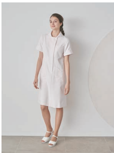
カーヴィースリーブワンピース