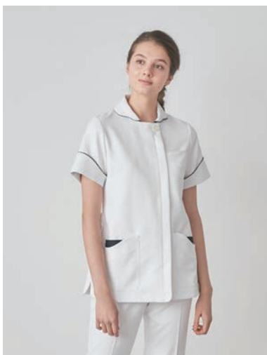
カーヴィースリーブトップス