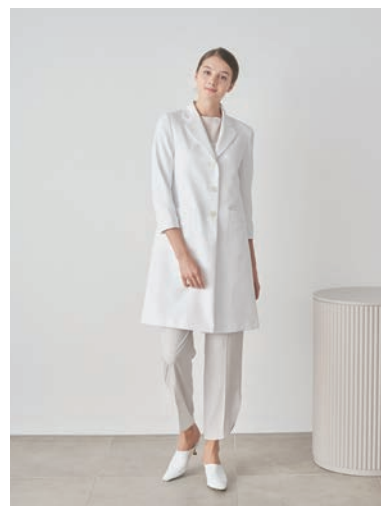
カーヴィーテラードコート

●カラー：ホワイト (背裏ボタニカルピンク柄) / ホワイト (背裏ブルーレモン柄)