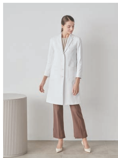
フォーラインテラードコート

●カラー：ホワイト (背裏ボタニカルピンク柄) / ホワイト (背裏ブルーレモン柄)