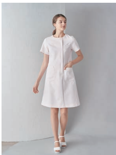
フォーラインスリーブワンピース